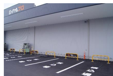
「サッと出れる積み込み場」

また、早朝営業（6時30分～）を実施することで、朝早い建設現場での作業開始前にもご利用いただけます。