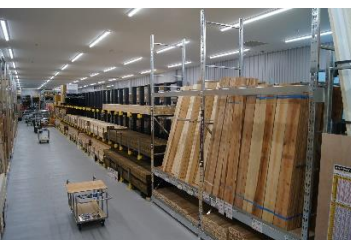
「広くとった軒下売場」