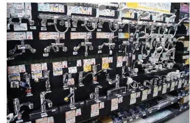
「各種取り揃えた水道関連商品」