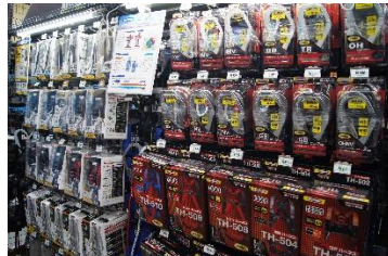
「近年高まっている作業現場での安全に対するニーズにお応えした商品」