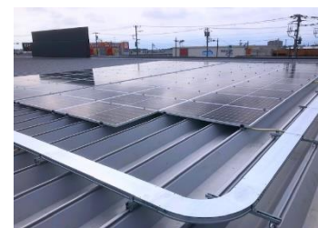
「太陽光発電システム」