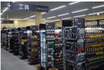
「豊富な品揃えの工具」

特に、金属類のビスやネジなどの商品は、様々な種類を使用することを想定し、当社最大級の約 10,000 アイテム ※1 を用意するとともに、塗料や補修商材など、お客さまから要望が多い内装関連の商品も約 3,000 アイテム ※1 取り揃えました。