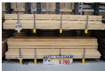
「品質にこだわった木材関連商品」