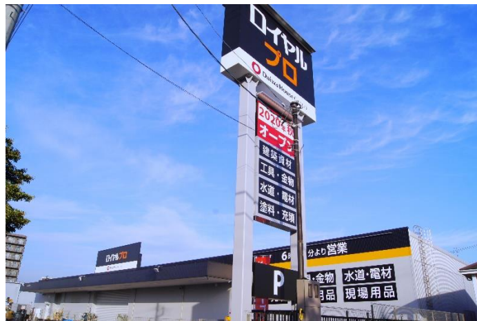
【ロイヤルプロ藤沢並木台】

大和ハウスグループのロイヤルホームセンター株式会社（本社：大阪市西区、社長：中山正明）は、2020年11月5日（木）、神奈川県藤沢市において、全国で59店舗目、神奈川県下で10店舗目となる「ロイヤルプロ藤沢並木台」をオープンします。